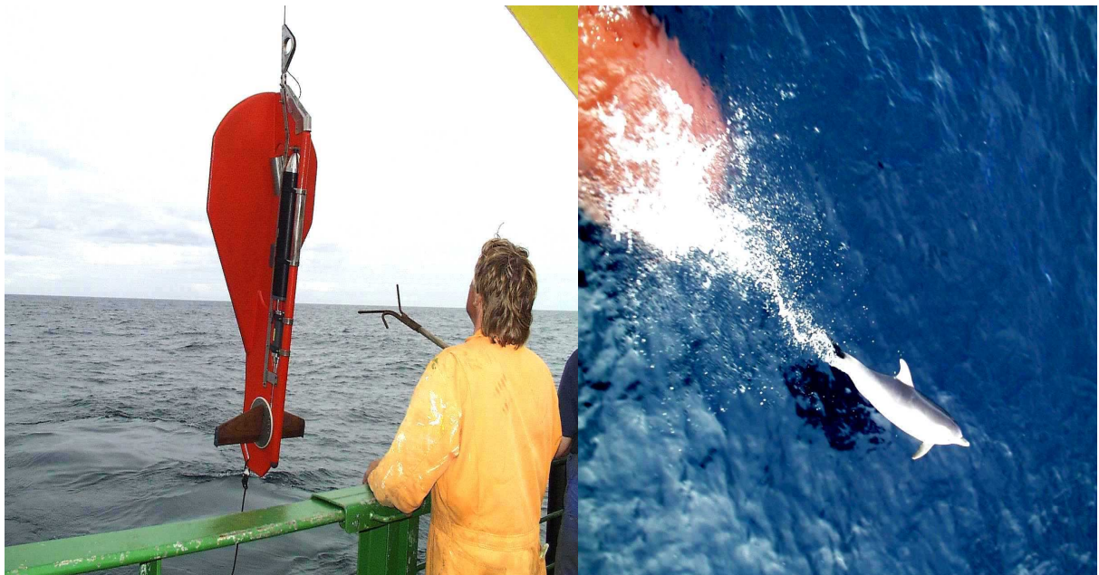
Delphine auf - und vor dem FS "Gauss"